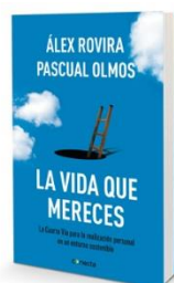
"La vida que mereces" (Conecta, 2013). Escrito por Álex Rovira y Pascual Olmos

Porque vivimos en un modelo de economía neoliberal donde no somos sujetos, somos objetos.